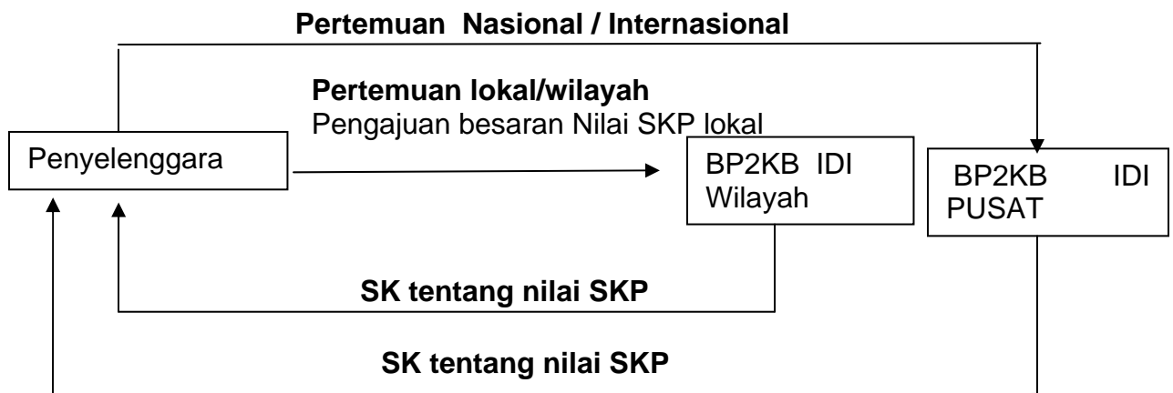
Gambar 1. Alur pengajuan nilai SKP kegiatan pendidikan eksternal (kegiatan 4) P2KB